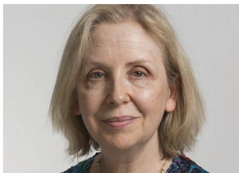
린 가드너 Lyn Gardner

예리한 통찰력과 따뜻한 문체로 사랑받는 영국의 대표 연극 평론가. 25년간 가디언(The Guardian)에서 연극 평론가 및 기획기사 기자로 활동하며 주류 작품부터 프린지까지 폭넓은 작품을 조명해왔다. 현재 더 스테이지(The Stage) 부편집장으로 활동하며 공연예술 전반에 대한 깊이 있는 비평과 분석을 이어가고 있으며, 대담하고 공정하며 세계를 향해 열린 공연예술 문화를 만드는 데 꾸준히 기여하고 있다.