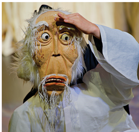
연희공방 음마갱쟁 EUMMA

안무 김유미 | 대본 석한남 | 기술감독 김진우 기획 이주경 | 출연 이민규, 박준섭, 김응민, 김민선, 정예영, 고지희, 박영현