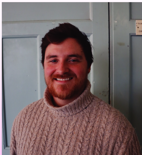
톰 포스터 Tom Forster

예리한 통찰력과 따뜻한 문체로 사랑받는 영국의 대표 연극 평론가. 25년간 가디언(The Guardian)에서 연극 평론가 및 기획기사 기자로 활동하며 주류 작품부터 프린지까지 폭넓은 작품을 조명해왔다. 현재 더 스테이지(The Stage) 부편집장으로 활동하며 공연예술 전반에 대한 깊이 있는 비평과 분석을 이어가고 있으며, 대담하고 공정하며 세계를 향해 열린 공연예술 문화를 만드는 데 꾸준히 기여하고 있다.