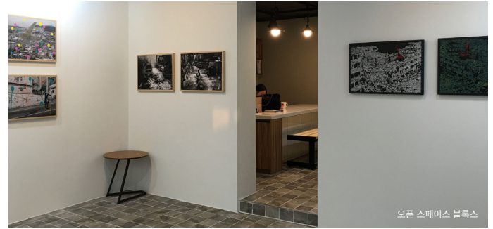
오픈 스페이스 블록스

주소 성남시 수정구 공원로 349번길 14-1 분야 문화공방 전화 010-5808-5250 홈페이지 cafe.naver.com/jmartmarket+ 휴관일 월요일 관람시간 문의 입장료 무료