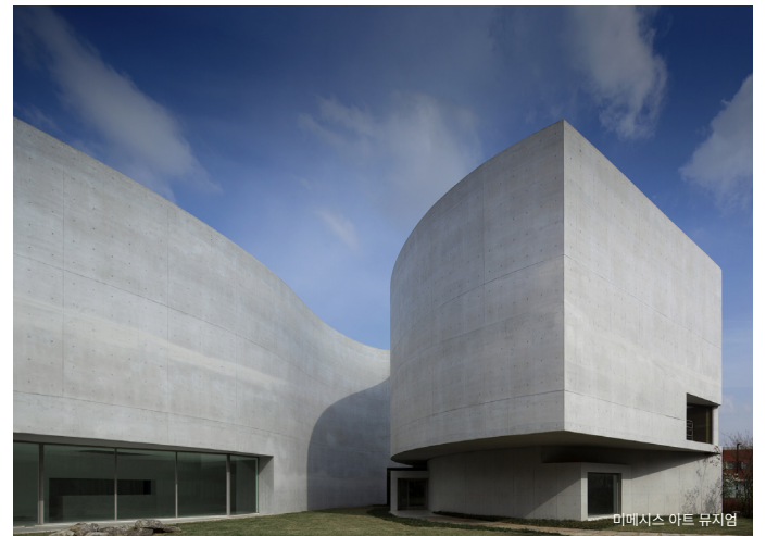
미메시스 아트 뮤지엄