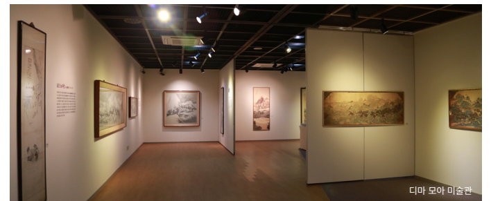
디마 모아 미술관